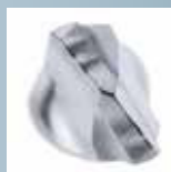
Power Breaker Schneidkante